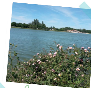
Le plan d'eau

Longer le fleuve pendant 1,5 km. Point de départ de la Coulée Verte, la Petite Prairie est un espace protégé pour la faune et la flore de cette prairie de fauche inondable.