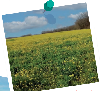
Champ au printemps

Pour en savoir + sur le patrimoine de la commune :