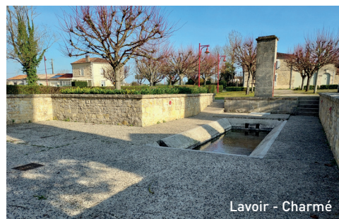
Lavoir - Charmé

5 Au bout du chemin, croisez la RD 185 au Moulin de Bellicou et prenez le chemin de la rivière sous la côte, en longeant le Bief jusqu'au pont de chemin de fer de Robegerbe. Vous remontez jusqu'au hameau de Moussac,